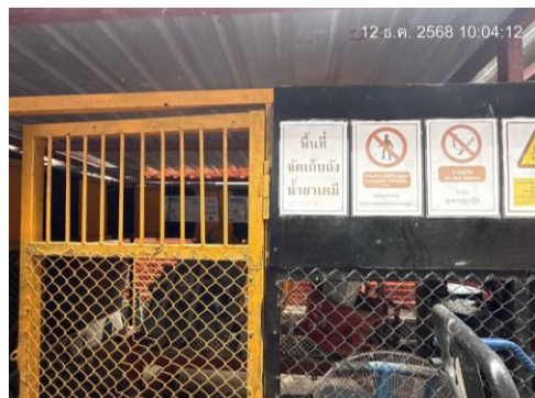
รูปที่ 1-1 สภาพภายในพื้นที่โครงการ ณ ถึงเดือนธันวาคม พ.ศ. 2568